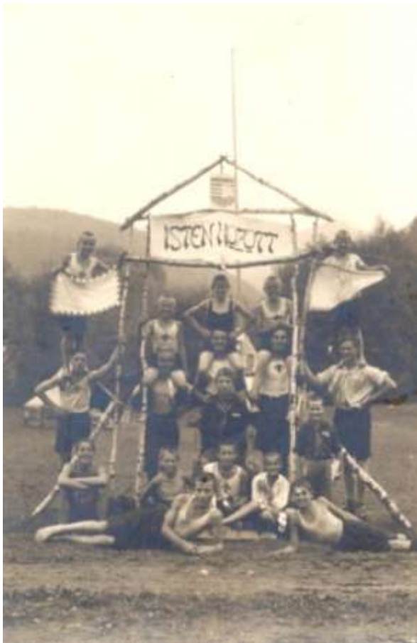
Košickí maďarskí skauti

Skauting plne podporoval uhorskú štátnosť a v čase 1. svetovej vojny sa vplyvom udalostí aj značne zmilitarizoval. V tomto období časť oddielov v Hornom Uhorsku najmä z dôvodu odchodu činníkov do armády zanikla. Po skončení vojny a vznikom následníckych národných štátov Uhorsko stratilo 2/3 svojho územia. Vzniklo Maďarské kráľovstvo, ale rozhodnutím medzinárodnej komisie v Trianone za jeho hranicami zostalo značné percento maďarského etnika (v Rumunsku, v Československu, v Juhoslávii, z časti aj v Rakúsku). V samotnom Maďarsku sa skauting rozvíjal v rámci Maďarského skautského zväzu. Do tohto zväzu prestúpili aj mnohé maďarské oddiely po anexii južného Slovenska v rokoch 1938 až 1945.