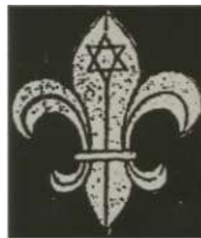
Odznak sionistických skautov.