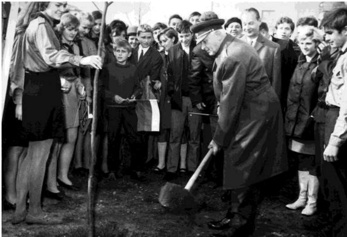
Slovenský junák, sadenie lípiek 28.10.1968 v Bratislave za účasti prezidenta republiky generála Ludvíka Svobodu a Alexandra Dubčeka.

Tramping fungoval nepretržite po celý čas zákazov skautingu. Po zrušení Slovenského Junáka a jeho začlenení pod Pioniersku organizáciu Socialistického zväzu mládeže ČSSR prešlo minimum skautských oddielov. Zopár oddielov prešlo k telovýchove – turistické oddiely mládeže (TOM), alebo sa im podarilo začleniť do organizácií zameraných na ochranu prírody. Mnoho zohratých skautských kolektívov (nielen skautských, aj z iných zrušených organizácií) pokračovalo neorganizovane. Boli základom pri vzniku nových trampských osád a posilnili trampské hnutie (napr. v Košiciach Klub OHIO, T.O. Rowers, T.O. Sosna, v Prešove T.O. Roveri Prešov,...). Tramping na Slovensku zaznamenal stúpajúci trend.