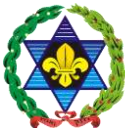
Znak Hašomeru Hacair

Jedným z cieľov Hašomeru bola alija – návrat do zeme predkov (Palestíny). K tomuto účelu hlavne u starších cofin prebiehali školenia v prípravkových strediskách, v ktorých ich pripravovali na život v hašomerských kibucoch. Príprava prebiehala už od polovice 20-tych rokov, no na intenzite nabrala až v rokoch 1933 – 1939. Po nástupe nacizmu v Nemecku hašomeri pomáhali pri emigrácii nemeckých a rakúskych Židov. V novembri 1938 žandári nahnali Židov bez čs. štátnej príslušnosti do medzihraničia (Niemandland) v okolí Kostolian nad Hornádom. Maďarsko ich odmietlo prijať a tak do vyriešenia situácie skauti z Hašomer Hacair zabezpečovali pre týchto bezdomovcov ubytovanie v stanoch a varenie stravy. Činnosť židovských skautských organizácií bola slovenskou autonómnou vládou začiatkom decembra zakázaná.