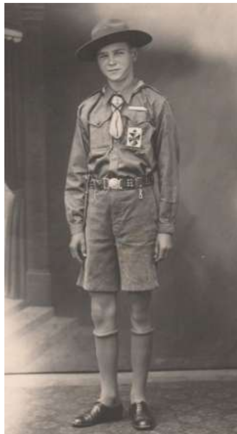
Dominikánsky skaut