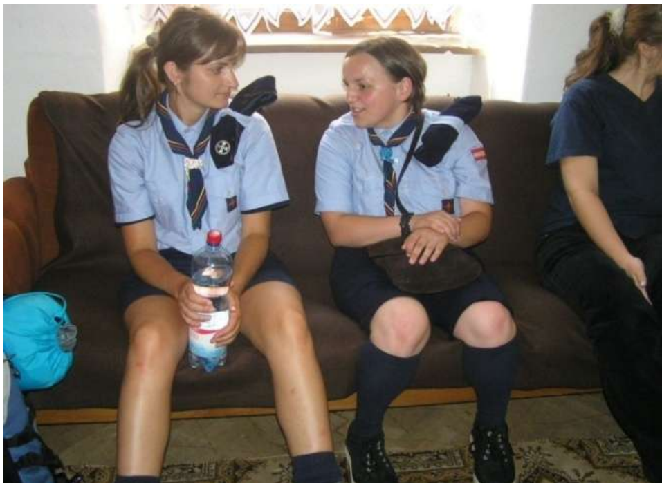
Skautky FSE/UIGSE z Litmanovej