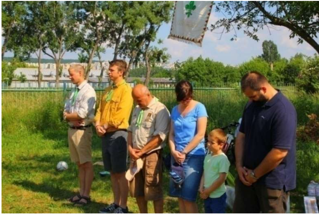
Zväz maďarských skautov na Slovensku, zbor Košice

Združuje skautov a skautky maďarskej národnosti žijúcich v Slovenskej republike. Centrum organizácie je v Dunajskej Strede. Organizačné jednotky maďarských skautov a skautiek sa nachádzajú v Bratislave, Čenkovciach, Dunajskej Strede, Filákovce, Gabčíkove, Hostovej, Komárne, Košiciach, Kráľovskom Chlmci, Leviciach, Moldave nad Bodvou, Nových Zámkoch, Podunajských Biskupiciach, Šahách, Tomášovciach, Trsticiach, Veľkých Kapušanoch a Veľkom Mederu. Nadväzujú na bohatú tradíciu maďarského skautingu. Zväz funguje dodnes.