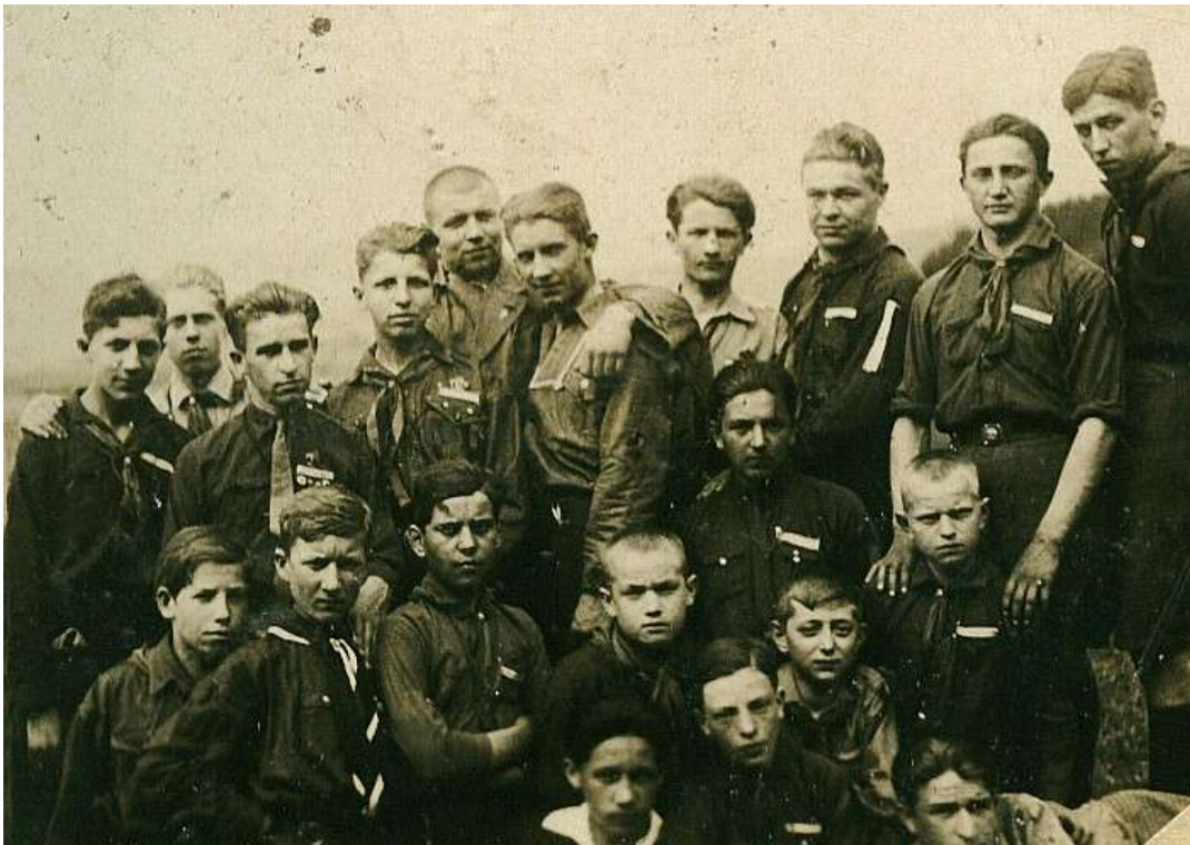
Zväz junákov – skautov RČS, 2. Oddiel Spišská Nová Ves (1928)

štruktúru a symboliku. V rámci Zväzu mali autonómne postavenie. Tieto skautské organizácie sú uvádzané aj ako samostatné spolky.