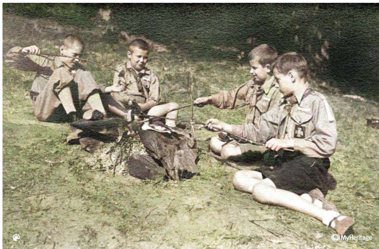
Slovenskí katolícki skauti