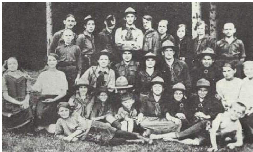
Spartakovi skauti práce z Kežmarku

Nitra, Nové Mesto nad Váhom, Trenčín a Trnava), 47. Hronec (oddiely Banská Bystrica, Banská Štiavnica, Brezno, Hronec, Horná Lehota, Lučenec, Valaská a Zvolen) a 54. Košice (oddiely Bardejov, Krompachy, Košice, Kežmarok, , Matejovce, Michalovce, Poprad, Prešov, Podolíneec a Spišská Belá). Existovali aj oddiely SSP, ktorým činnosť nebola povolená, napr. vo Veľkom Bieli. Postupne vznikali oddiely aj v Handlovej, Margecanoch Medzilaborciach, Pezinku, Piešťanoch, Seredi, Proletárski skauti sa pomerne často dostávali do rozporov so štátnou správou. Pomerne vysokú členskú základňu neskôr zdecimovala veľká hospodárska kríza. Jedno z posledných veľkých podujatí SSP pre verejnosť sa uskutočnilo 30. – 31.7.1938 v Košiciach. Ich činnosť na Slovensku bola zakončená zákazom na konci roka 1938.