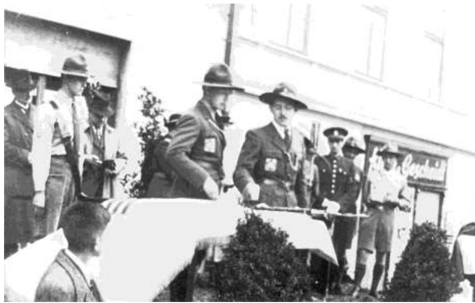
Vysviacka zástavy evanjelických skautov – Banská Bystrica, september 1938

V období prvej ČSR na Slovensku nebol rozšírený ani ďalší český fenomén, ktorého korene vychádzajú zo skautingu a woodcraftu – tramping (divokí skauti), ktorý v tých časoch existoval iba v okolí Bratislavy.