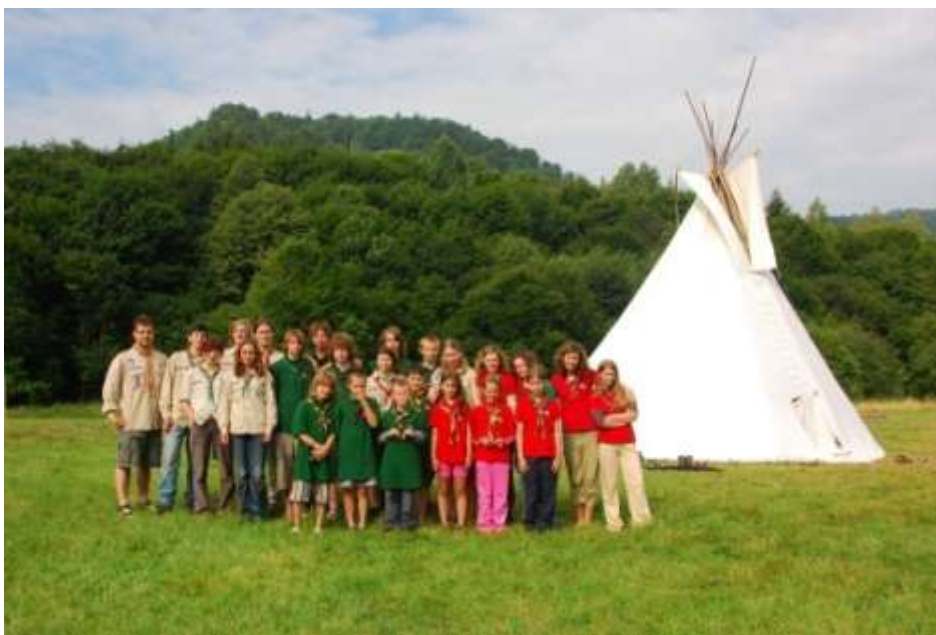
Slovenský skauting, tábor 49. Zboru Geronimo Prešov na Kurčine

Podobnú náplň činnosti ako Liga lesnej múdrosti má aj hnutie Euroindiánov.