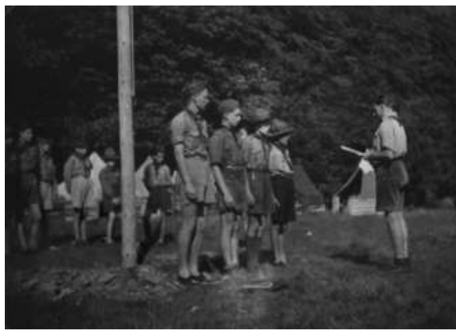
Slovenský junák, nástup na tábore v Permeku. Rok 1946 (Archív Zola Lombiho)

Zlikvidovaný nebol iba tramping, aj keď tiež bol „trňom v oku“ u stalinistických mocipánov. Problém bol v tom, že nemali oficiálnu organizáciu a tak nebolo ani čo administratívne „dobrovoľne“ rozpustiť. Mnoho bývalých skautov, aj woodcrafterov pokračovali v činnosti neorganizovane a posilnili tramské hnutie (napr. T.O Biely jastrab Bratislava). Niektoré tramské osady mali vodácke zameranie. V období 50-tych a 60-tych rokov vznikajú tramské osady aj v ostatných regiónoch Slovenska.